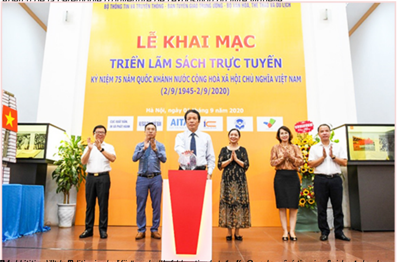
L'Exposition virtuelle de livres, organisée par le ministère de l'Éducation et de la Culture et le Centre national pour la préservation de