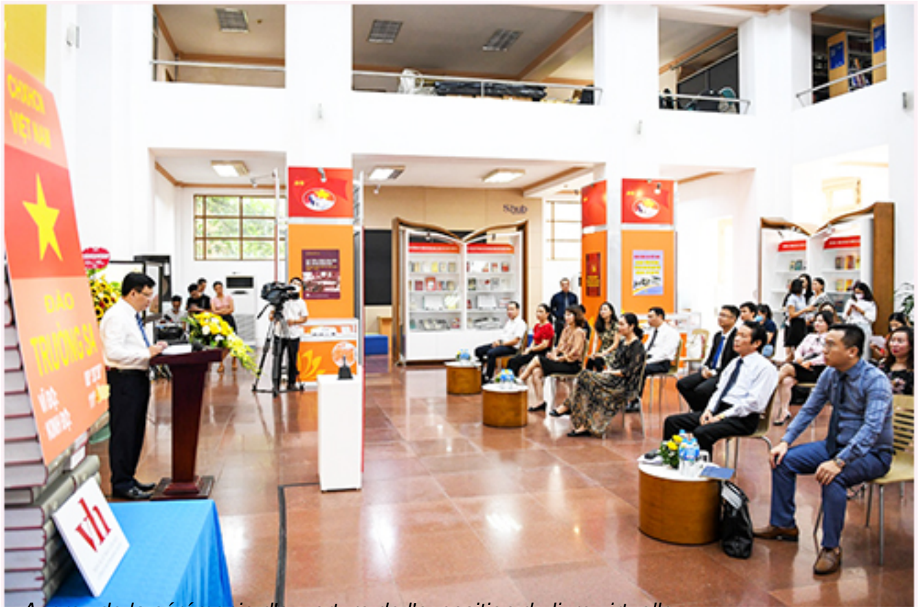
Aperçu de la cérémonie d'ouverture de l'exposition du livre virtuelle