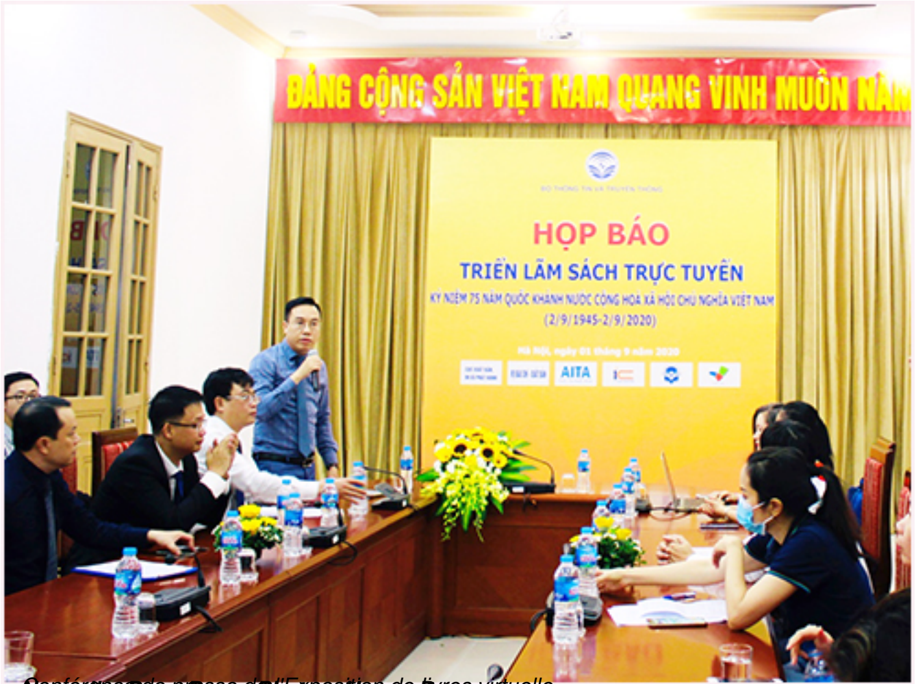
Novelle: Dang Dung, Photos: Hoang Dung virtuelle